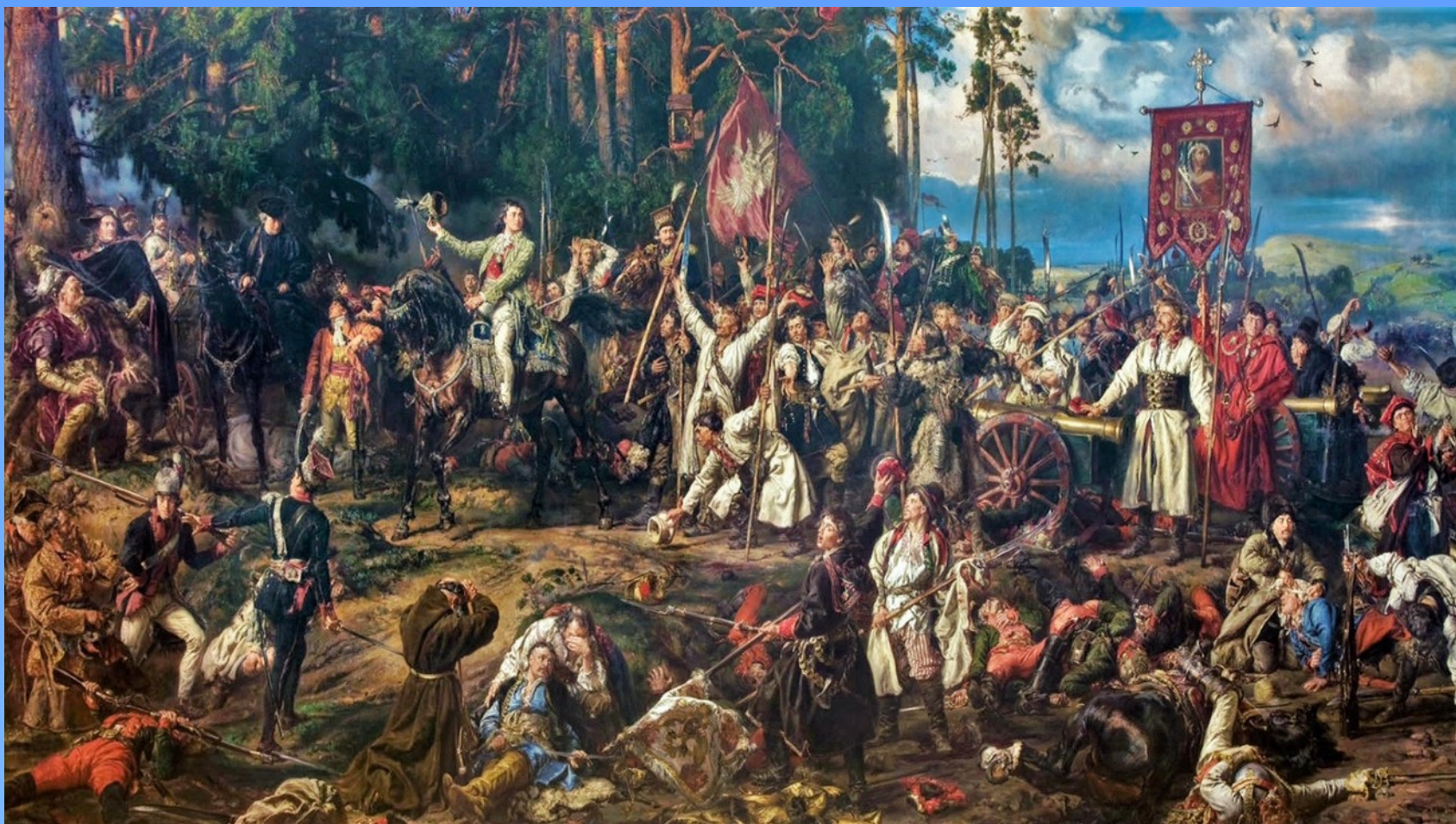
14. Tadeusz Kościuszko pod Racławicami - 4 kwietnia 1794