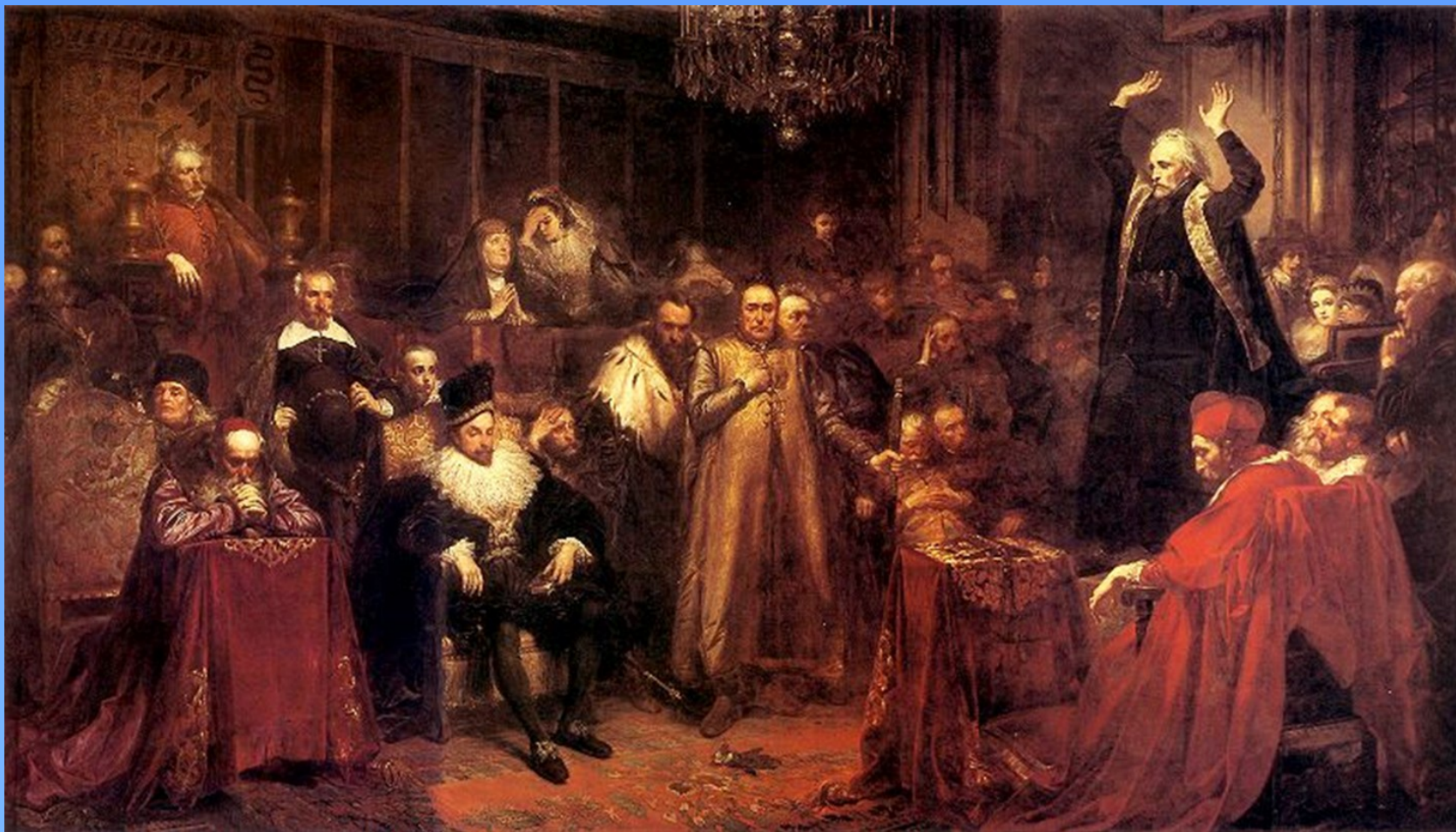
5. Kazanie jezuita Piotra Skargi – Zygmunt III Waza