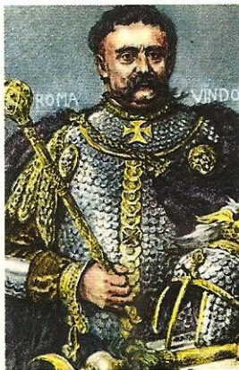
Jan III Sobieski (król w latach 1674–1696).

Lechistan – nazwa nadana Polsce przez Turków